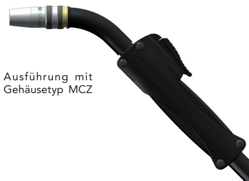
Ausführung mit Gehäusotyp MCZ