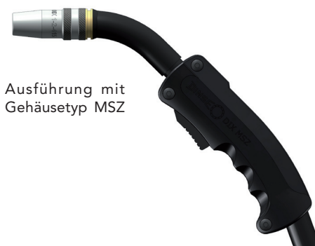
Ausführung mit Gehäusotyp MSZ