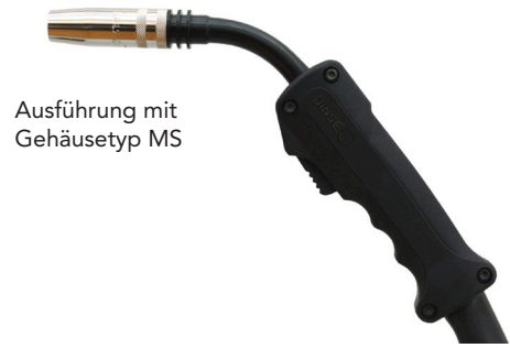
Ausführung mit Gehäuse Typ MS