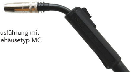
Ausführung mit Gehäuse Typ MC