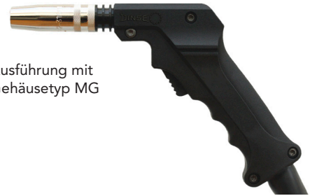
Ausführung mit Gehäuse Typ MG