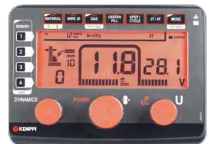
Oberfläche des Kempact A Bedienpanels

Ausführliche Produktinformationen sowie entsprechende Videos und News finden Sie unter www.kempki.com