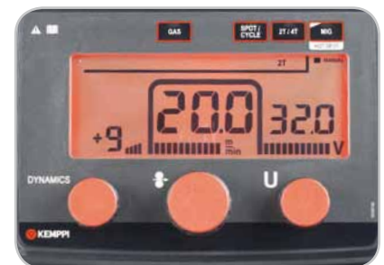
Oberfläche des Kempact R Bedienpanels

Zu den neuen technologischen Merkmalen gehören um mehr als 10 % gesenkte Energiekosten im Vergleich zu konventionell gesteuerten Stromquellen, die Brights™-Gehäusebeleuchtung für einfaches Drahtefädeln bei geringen Lichtverhältnissen, WireLine™-Serviceanzeige, die auf die Routinewartung der Drahtzufuhr hinweist sowie das integrierte GasMate™-Gehäusedesign, um das Laden der Gaszylinder und das Bewegen der Maschine einfach und sicher zu machen. Ganz gleich, welches Modell Sie wählen: Kempact RA gewährleistet optimale Ergebnisse für jede Schweißaufgabe.