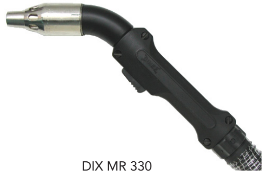
DIX MR 330