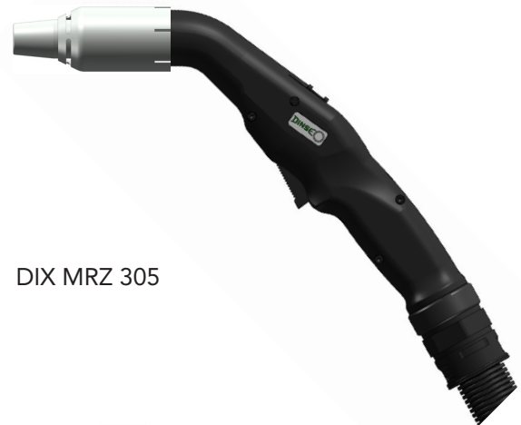
DIX MRZ 305